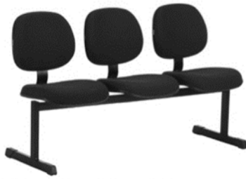
Longarina 3 lugares