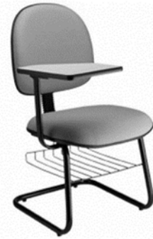
Cadeira fixa auditório