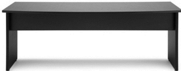
Mesa para auditório