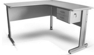
Estação de trabalho