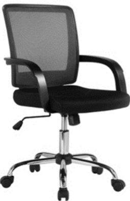
Cadeira - Presidência