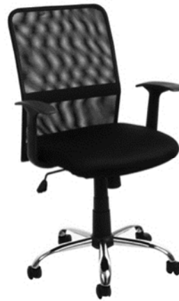
Cadeira giratória - secretária